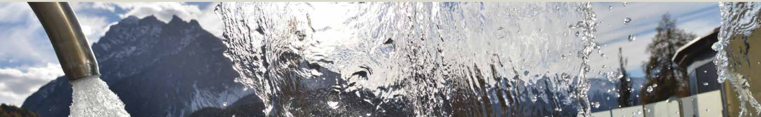
Cuntrada da bogns dadoura / Bäderlandschaft aussen