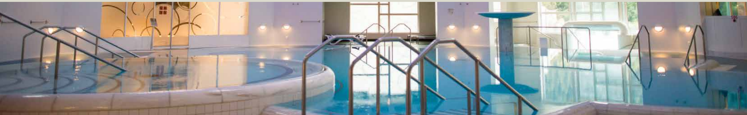
Cuntrada da bogns dadaint / Bäderlandschaft innen