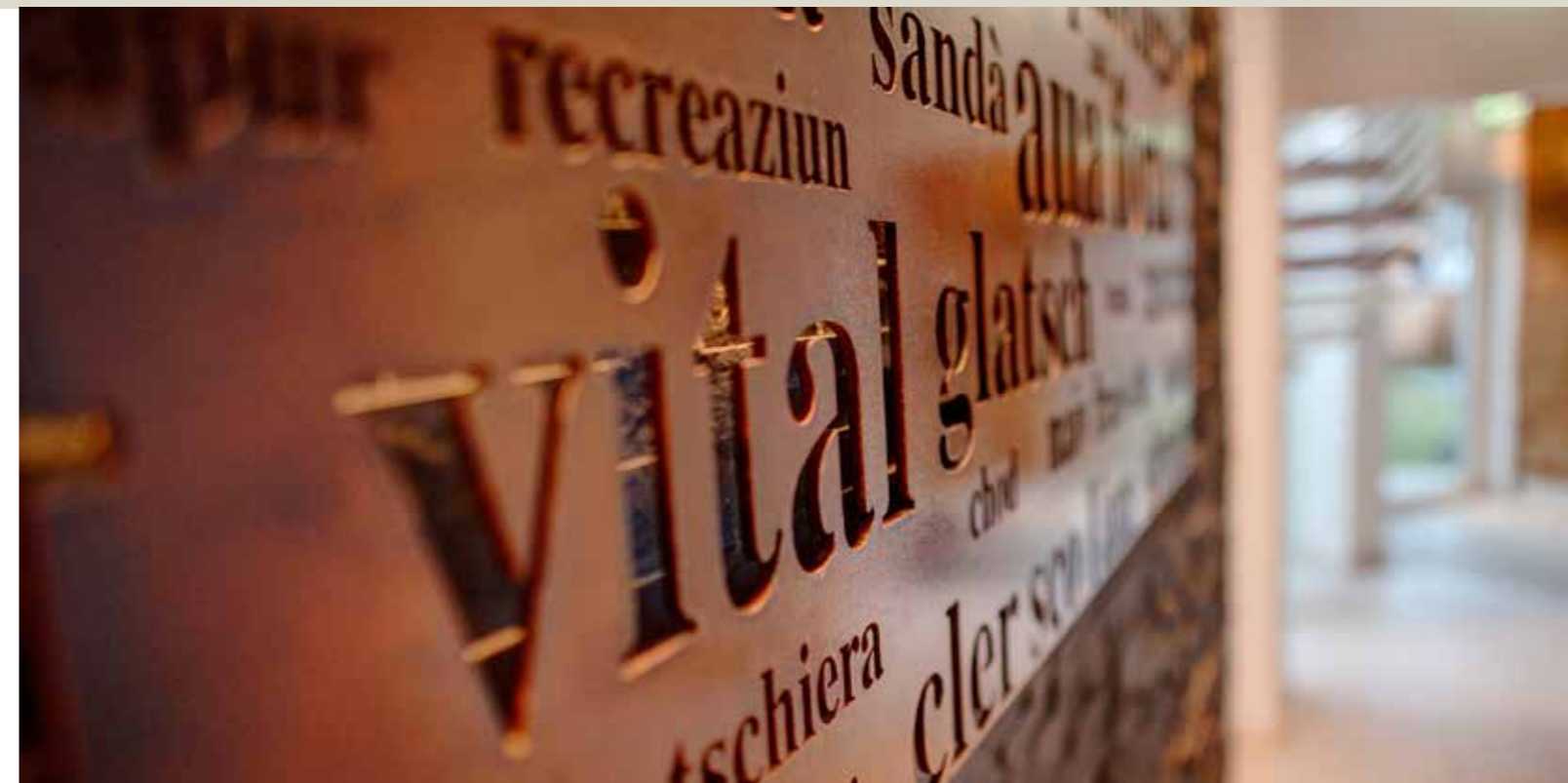
Entrada cuntrada da saunas / Eingang Saunalandschaft