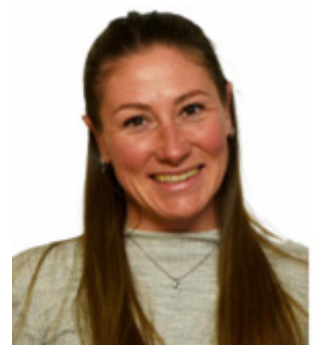
Hanna Tumler Spitex