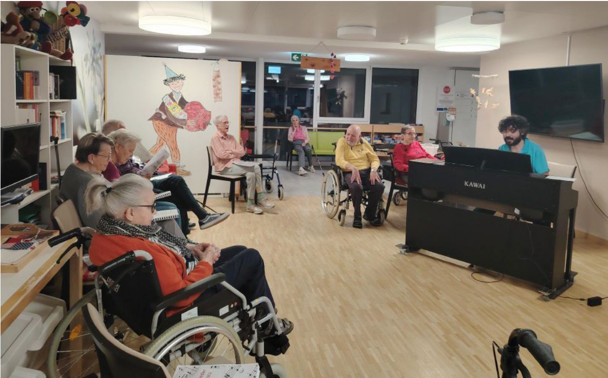
Beim gemeinsamen Musizieren in der Chasa Puntota