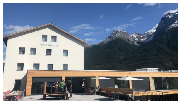
La Chasa Puntota dal 1956 ed hoz